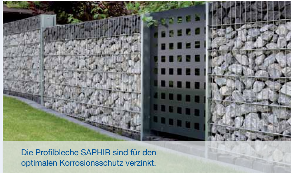
Die Profilbleche SAPHIR sind für den optimalen Korrosionsschutz verzinkt.