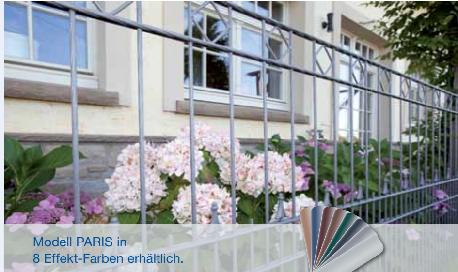
Modell PARIS in 8 Effekt-Farben erhältlich.